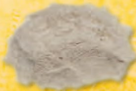
FARINA 100% FARRO - N.330