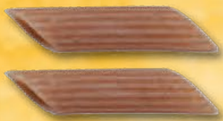
PENNE RIGATE - N.371