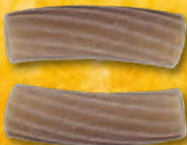
TORTIGLIONI - N.321