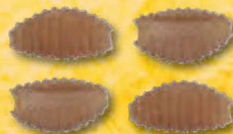
GNOCCHETTI SARDI - N.355