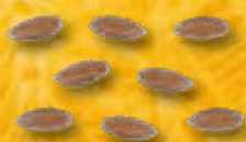
ORZO - N.323