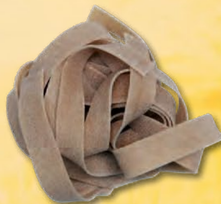
PAPPARDELLE - N.303