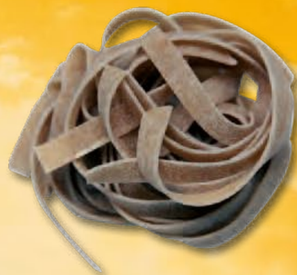
TAGLIATELLE - N.301