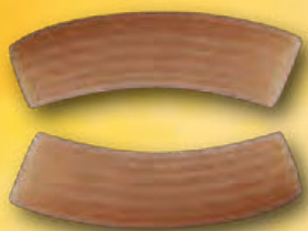
RIGATONI - N.338