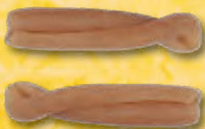
CASARECCE - N.354