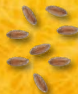
FARRO IN CHICCHI - N.317