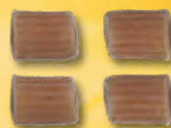
DITALI RIGATI - N.306